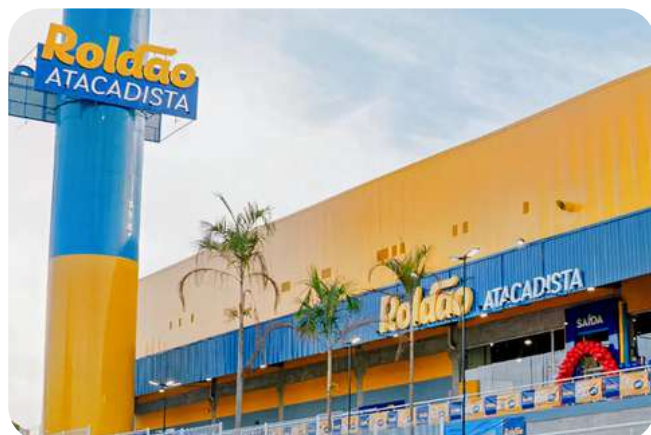
Roldão Atacadista 54.000 m2