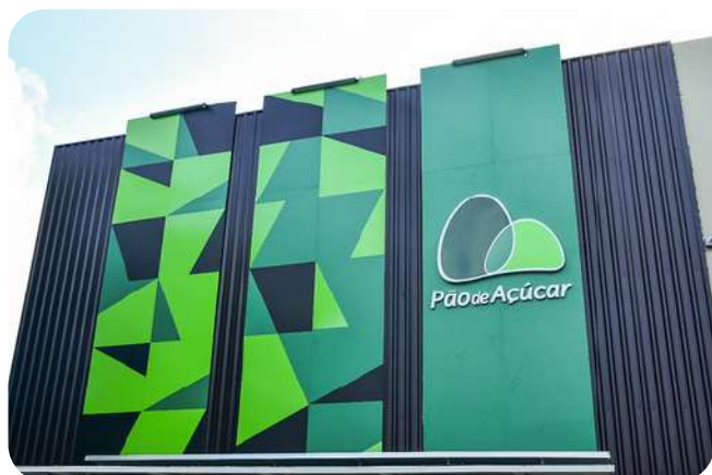
Pão de Açúcar 7.000 m2