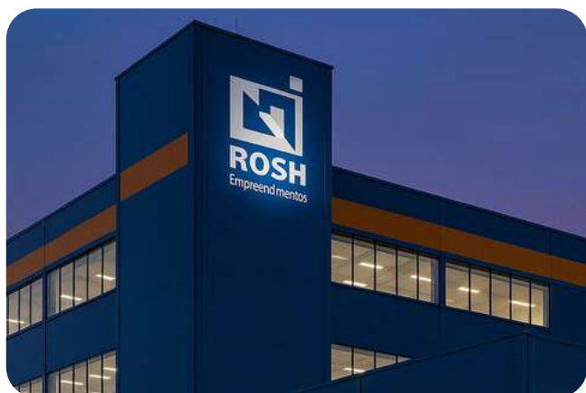
Rosh Empreendedorismo 60.000 m 2