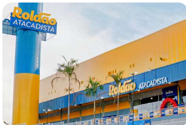
Roldão Atacadista 54.000 m 2