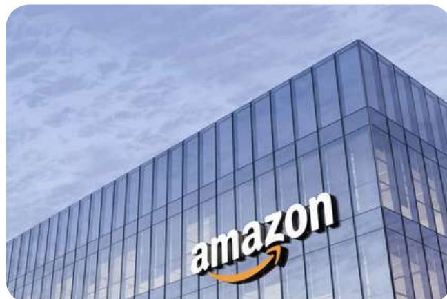
Amazon 48.000 m 2