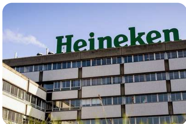
Heineken 80.000 m2