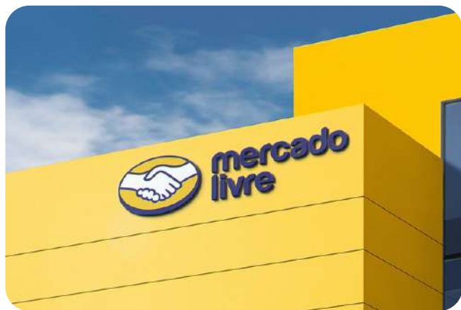
Mercado Livre 40.000 m2