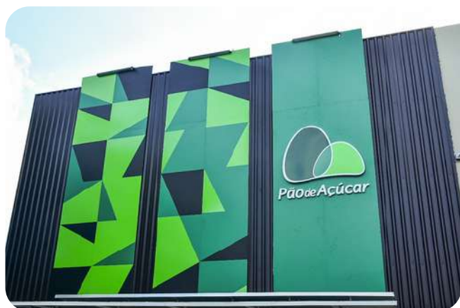
Pão de Açúcar 7.000 m2