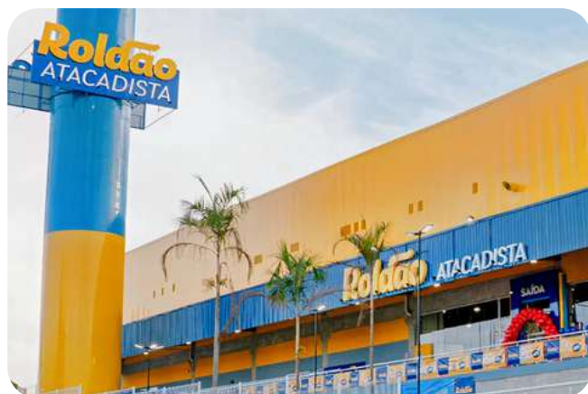
Roldão Atacadista 54.000 m2